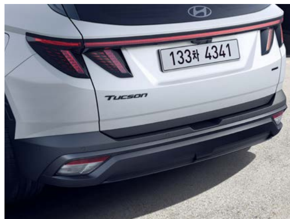
블랙 익스테리어 전용 디자인(프론트 범퍼) 블랙 익스테리어 전용 디자인(리어 범퍼)