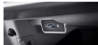
빌트인 캠 2 전용 마이크로 SD카드(128GB)