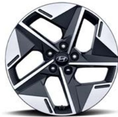
18인치 알로이 휠