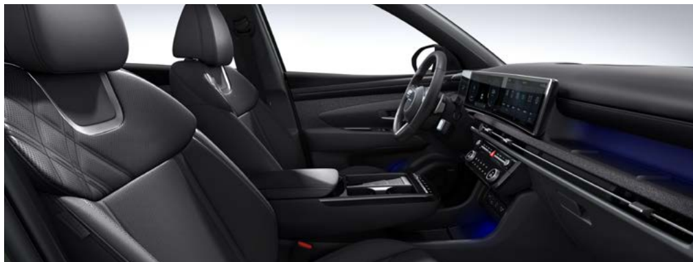
퀼팅 천연가죽 시트