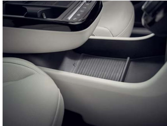
플로팅 콘솔 전자식 변속 칼럼(진동 경고)