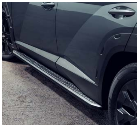
사이드 스텝 어드벤처