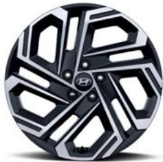
19인치 알로이 휠