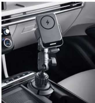
컵홀더 핸드폰 거치대