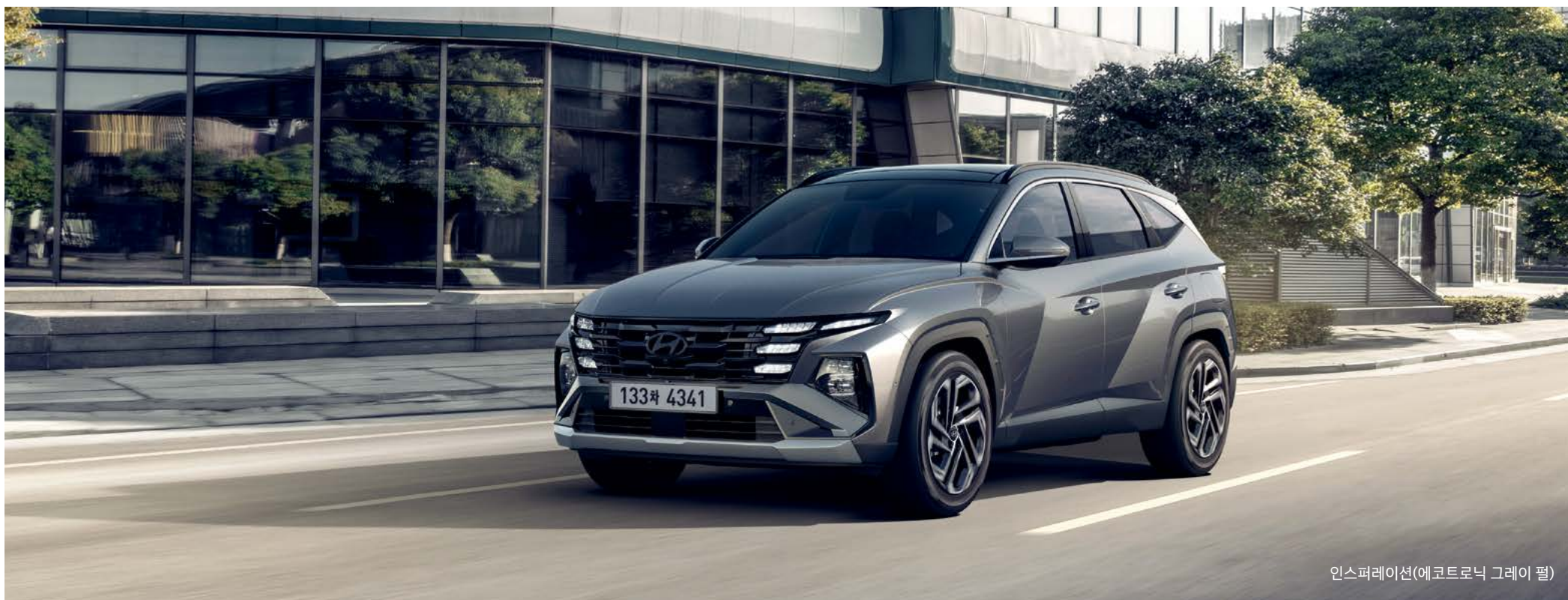
인스퍼레이션(에코트로닉 그레이 펄)

강력한 동력 성능과 효율적인 연비를 겸비한 하이브리드를 비롯해 가솔린 엔진까지 최적화된 파워트레인 라인업을 갖추었습니다.