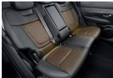
12.3인치 내비게이션(인카페이먼트/e hi-pass) 2열 열선시트