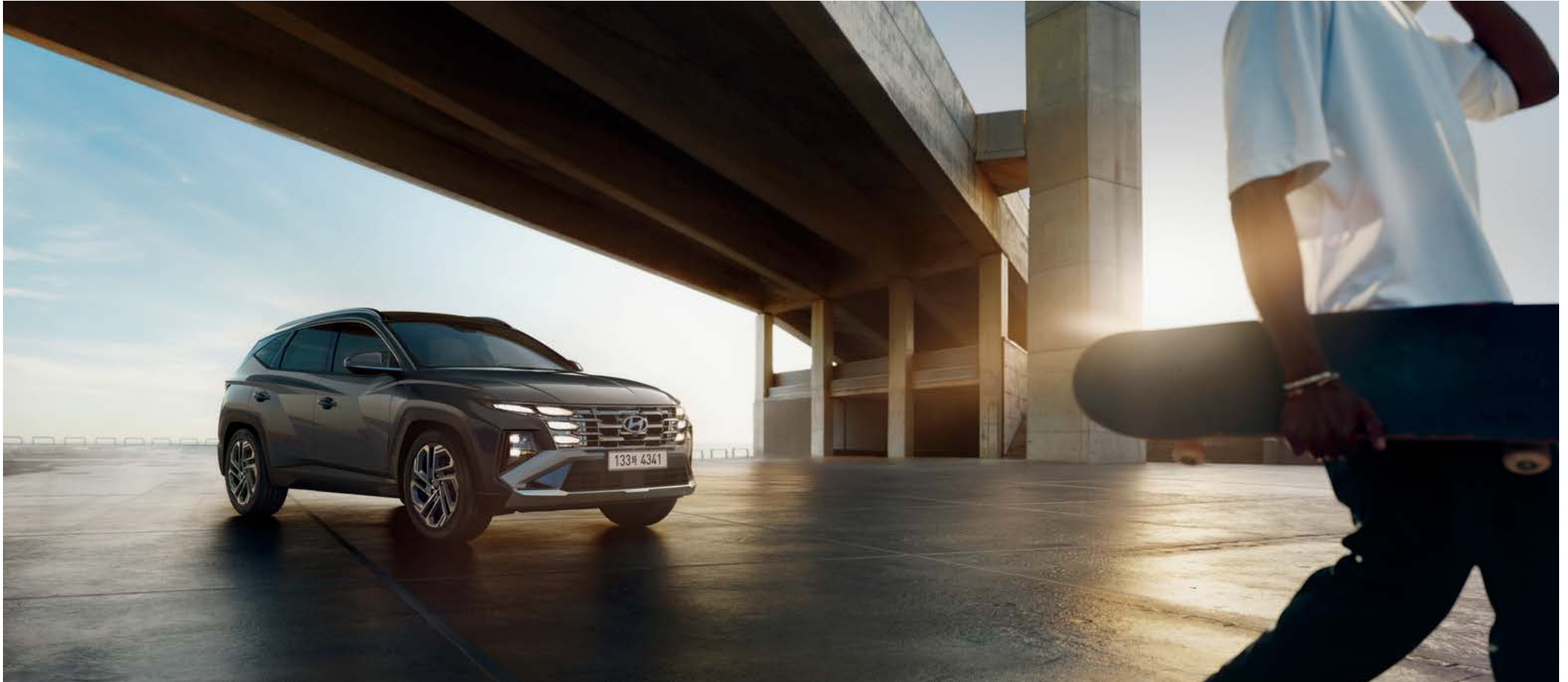
TUCSON 디지털 카탈로그 (PC/태블릿)