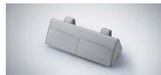
선바이저 선글라스 케이스