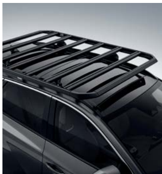
루프 플랫폼 바스켓