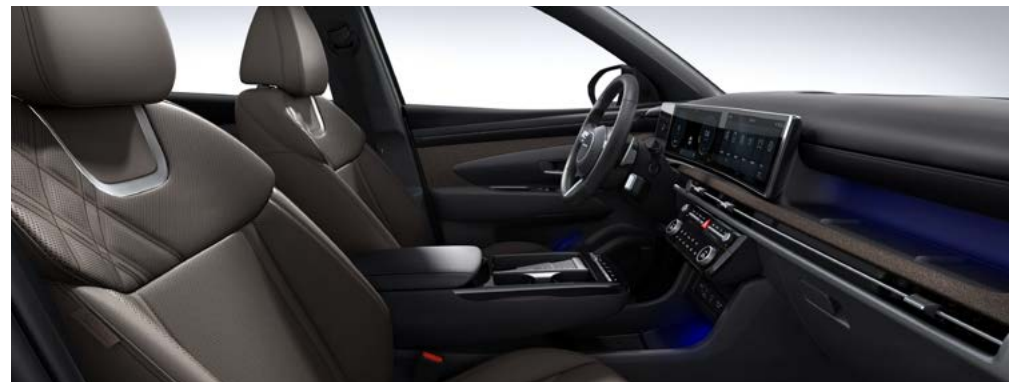
퀼팅 천연가죽 시트