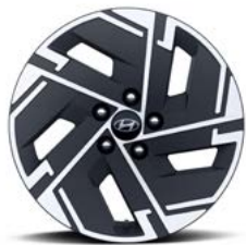
17인치 알로이 휠 (하이브리드 전용)