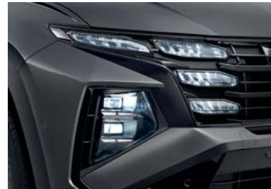
Full LED 헤드램프(프로젝션 타입, 히든라이팅 주간주행등/지능형 헤드램프 포함) 퀵팅 천연가죽 시트