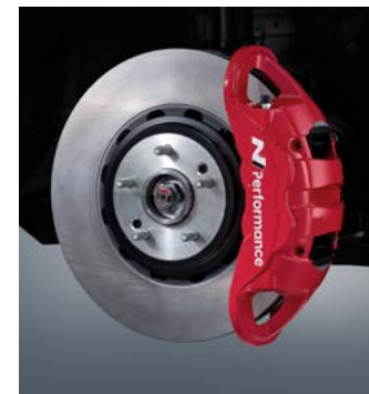
모노블록 브레이크 시스템