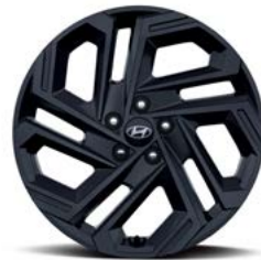
19인치 알로이 휠 (블랙 익스테리어 전용)