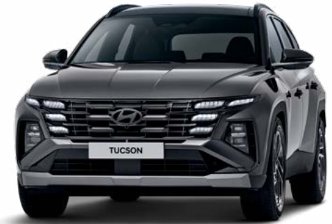
인스퍼레이션(에코트로닉 그레이 펄)