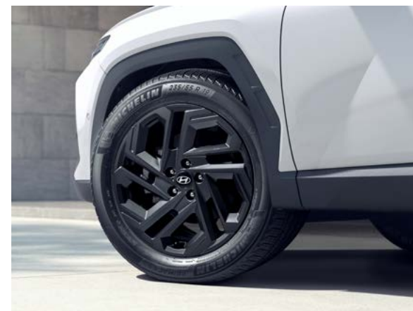
블랙 DLO 몰딩 19인치 전용 블랙 알로이 휠 & 타이어