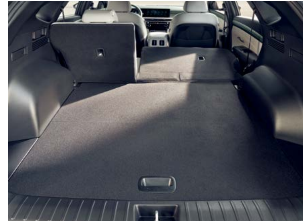
2열 6:4 분할 폴딩 2열 폴드 & 다이브 시트 * 가솔린 1.6 터보 하이브리드 차량 미적용