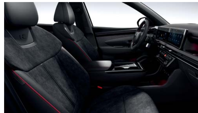
스웨이드 + 천연가죽 시트