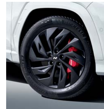
19인치 매트블랙 경량 휠(리얼 카본 휠캡)

* N Performance parts 상품은 하이브리드 차량에 적용 불가합니다. * C to USB-A 변환 젠더는 현대자동차 전용 개발 제품으로 타 제품 및 타 자동차 브랜드에서는 작동을 보장하지 않습니다.