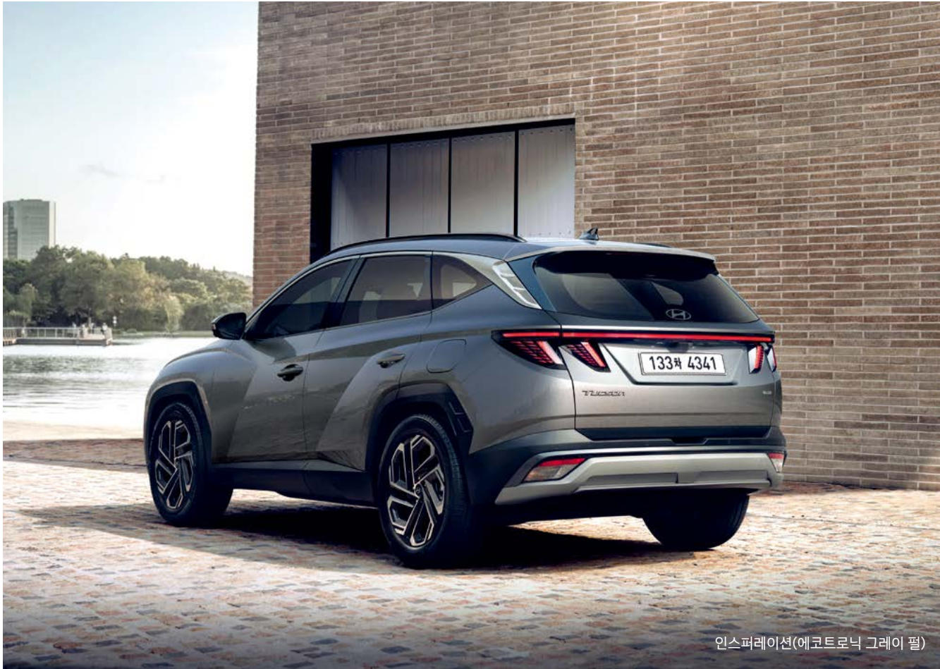
인스퍼레이션(에코트로닉 그레이 펄)