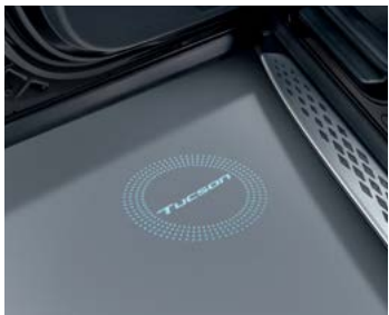
LED 도어스팟 램프(1열)