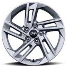
17인치 알로이 휠