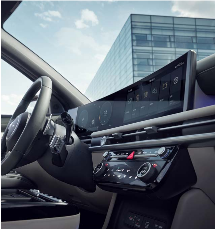
파노라믹 커브드 디스플레이