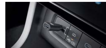
C to USB-A 변환 젠더