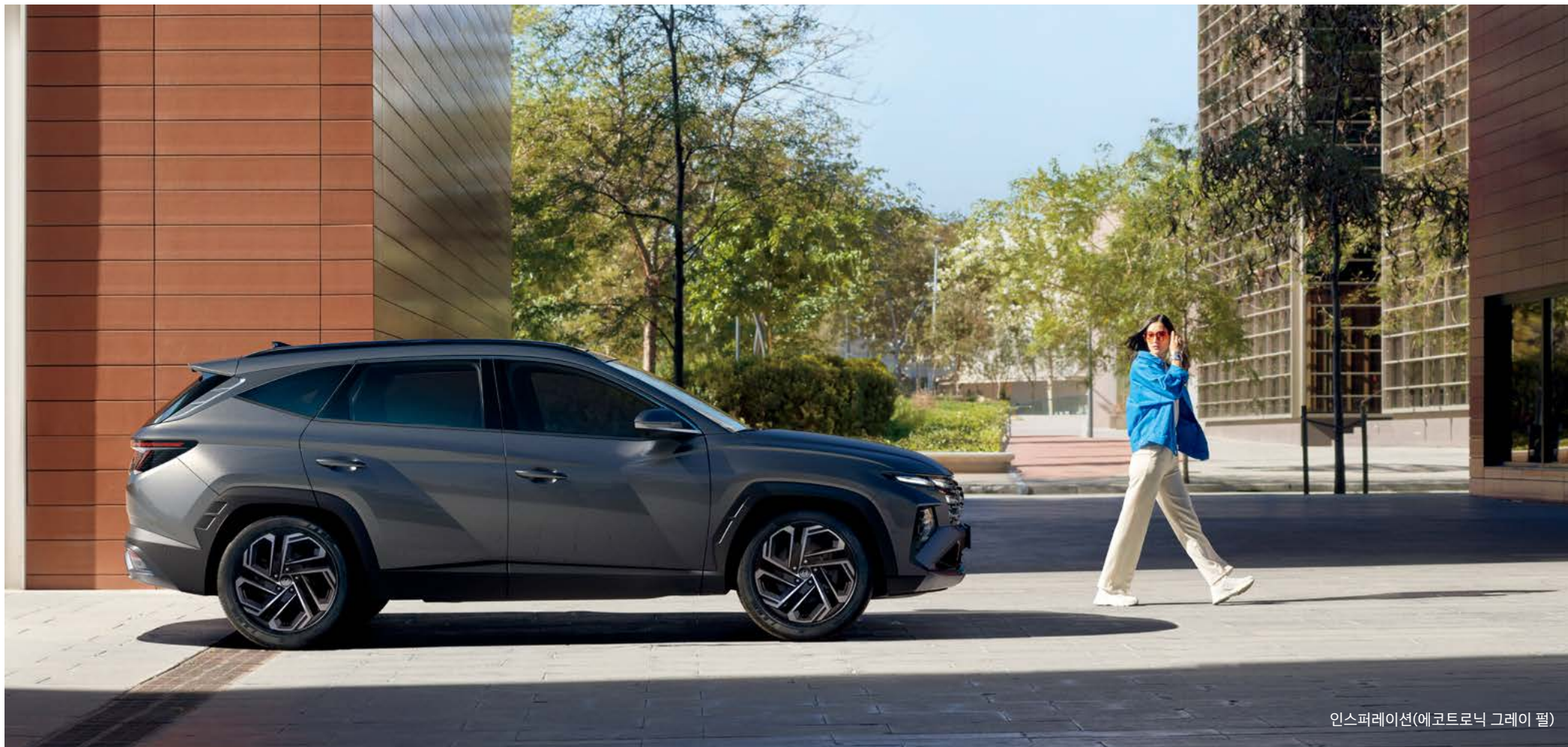
인스퍼레이션(에코트로닉 그레이 펠)