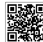
TUCSON 디지털 카탈로그 (PC/태블릿)