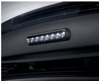
LED 테일게이트 램프(터치방식)