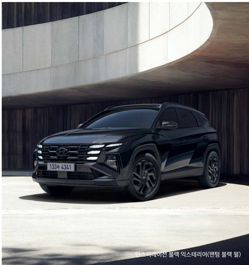
인스퍼레이션 블랙 익스테리어(팬텀 블랙 펠)