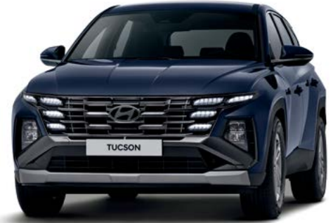
모던(오션 인디고 펄)