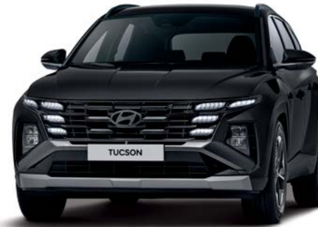
프리미엄(펜텀 블랙 펄)