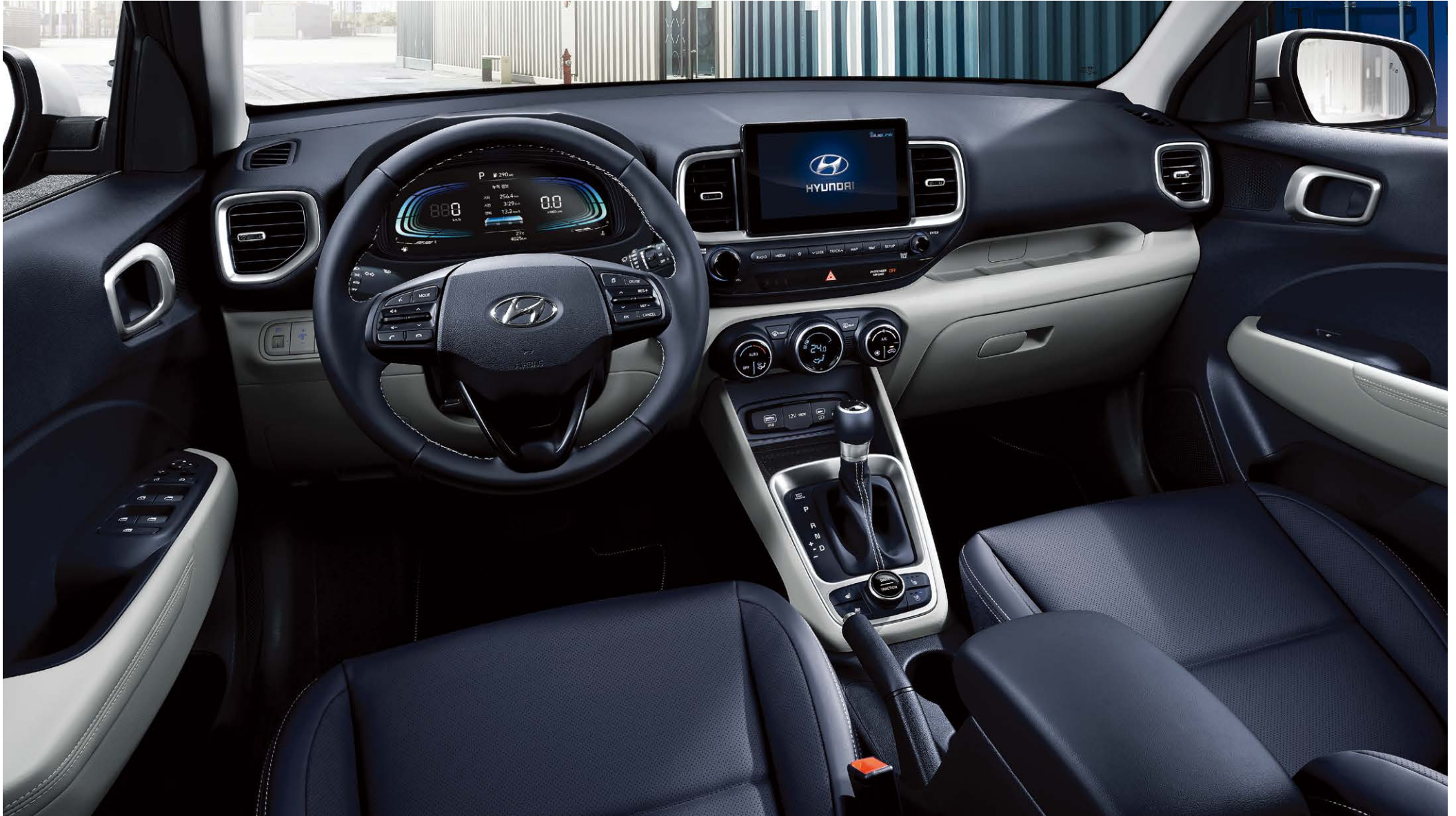
프리미엄 풀옵션(메테오 블루)

* 인포테인먼트 시스템 화면 이미지는 업데이트에 따라 변동될 수 있습니다.