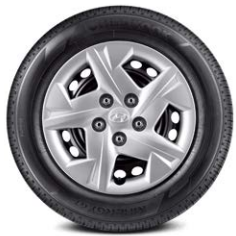
185/65R15 타이어 & 15인치 스틸 휠