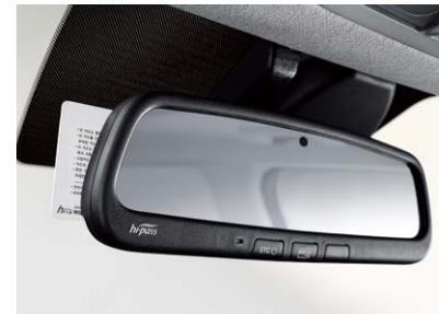
LED 헤드램프(프로텍션 타입) 하이패스(ECM 적용)