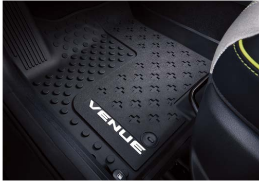
프로텍션 매트 패키지(플로어 매트, 러기지 프로텍션 매트)