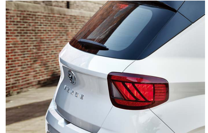
LED 리어 콤비램프 17인치 알로이 휠 & 타이어