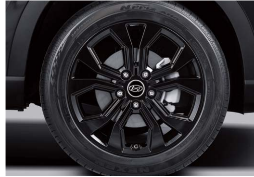
17인치 블랙 알로이 휠 프리미엄 스피커(케블라콘)