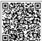
현대인증을고차 트레이드인 혜택 안내