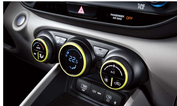
에어벤트 풀오토 에어컨