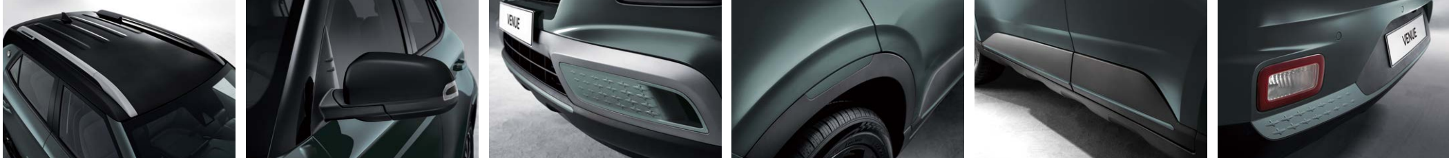
미라지 그린/어비스 블랙 펄 투톤