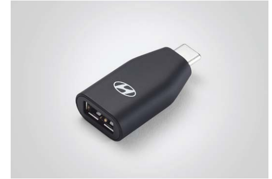
C to USB-A 변환 젠더* A to USB-C 변환 젠더*