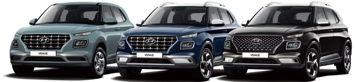
스마트 풀옵션(미라지 그린) / 프리미엄 풀옵션(데님 블루 펄/초크 화이트 메탈릭 투톤) / 플렉스 풀옵션(어비스 블랙 펄/초크 화이트 메탈릭 투톤)