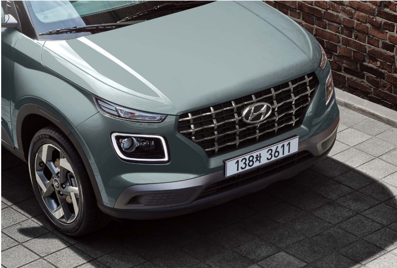
캐스케이딩 그릴 / LED 헤드램프