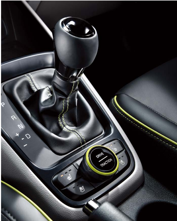
기어노브 & 2WD 험로 주행 모드 스위치