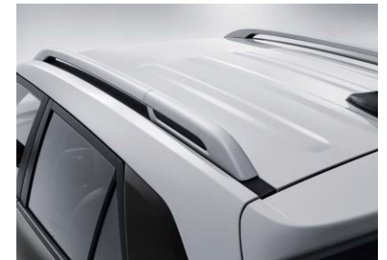
LED 리어 콤비 램프 루프랙