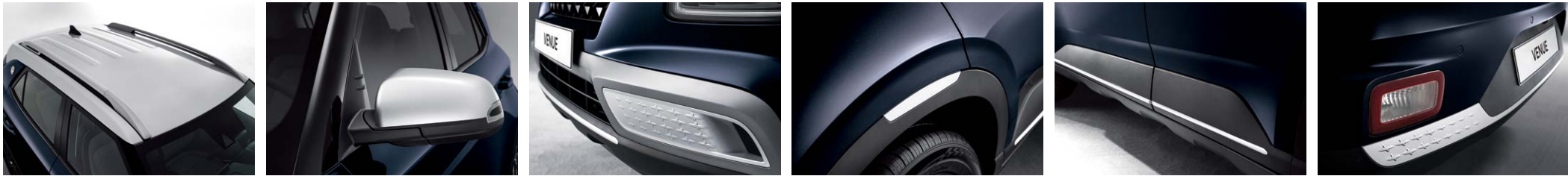
데님 블루 펄/초크 화이트 메탈릭 투톤

투톤 루프 컬러는 총 2종(초크 화이트 메탈릭/어비스 블랙 펄)입니다. 초크 화이트 메탈릭 루프 선택 시, 컬러포인트는 초크 화이트 메탈릭 컬러로 적용됩니다. 어비스 블랙 펄 루프 선택 시, 아웃사이드 미러는 어비스 블랙 펄 컬러로 적용되며 그 외 컬러포인트는 바디 컬러로 적용됩니다.