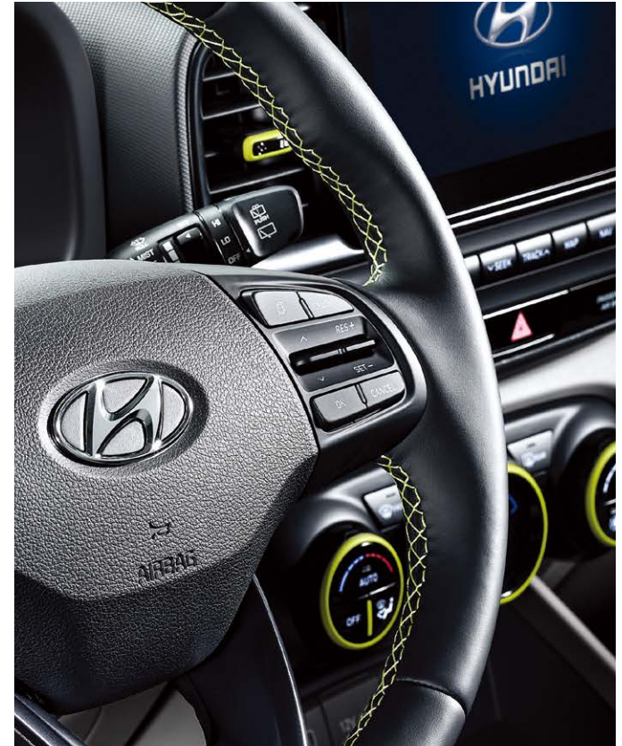
가죽 스티어링 휠(FLUX 전용 스티치 포함)