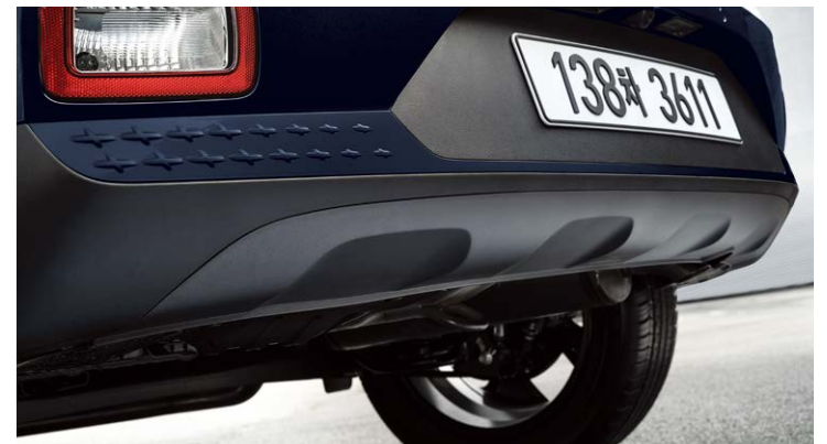
C필러 배지 FLUX 전용 리어스키드