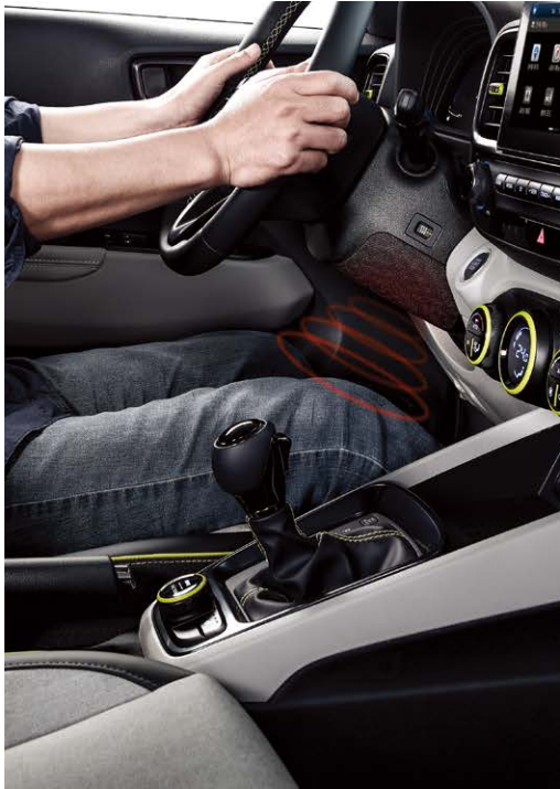
적외선 무릎 워머