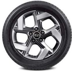
205/55R17 타이어 & 17인치 알로이 휠