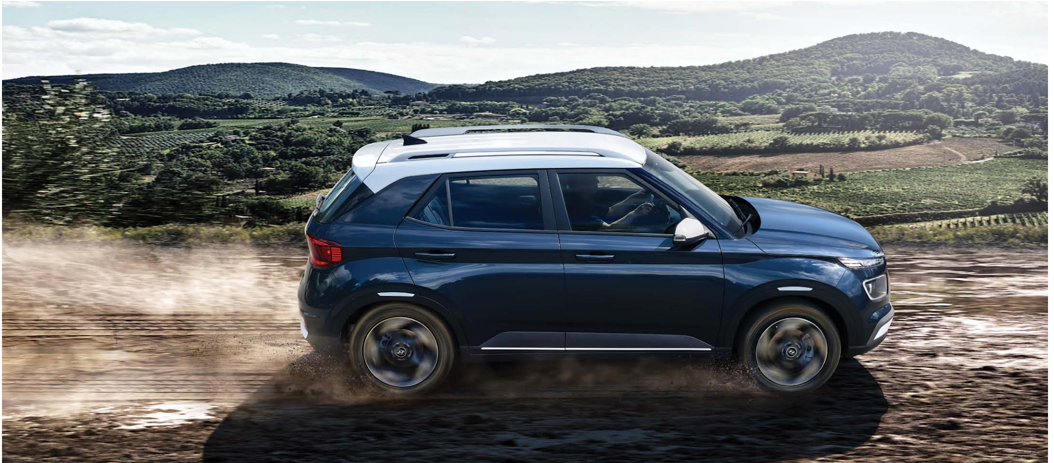
프리미엄 풀옵션(데님 블루 펄/초크 화이트 메탈릭 투톤)