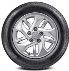
185/65R15 타이어 & 15인치 알로이 휠