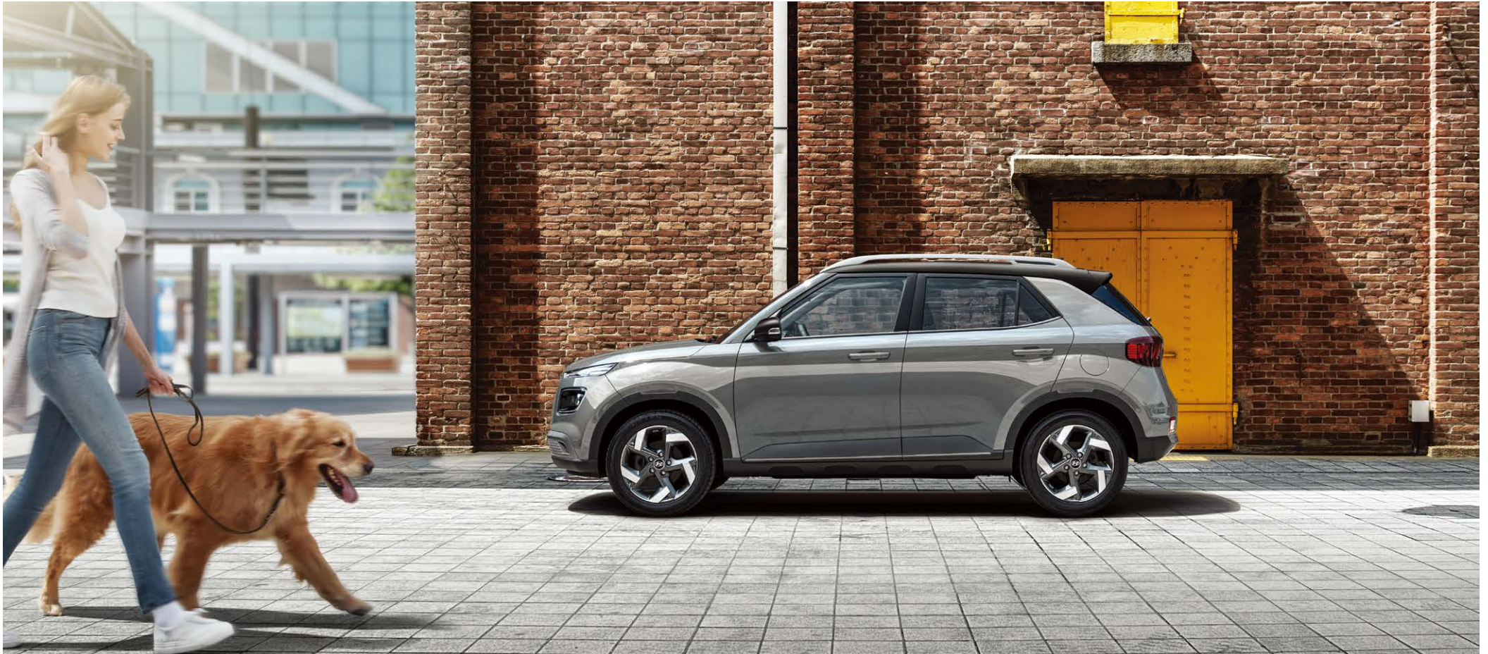
프리미엄 풀옵션(사이버 그레이 메탈릭/어비스 블랙 펠 투톤)