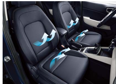
8인치 내비게이션 1열 통풍시트