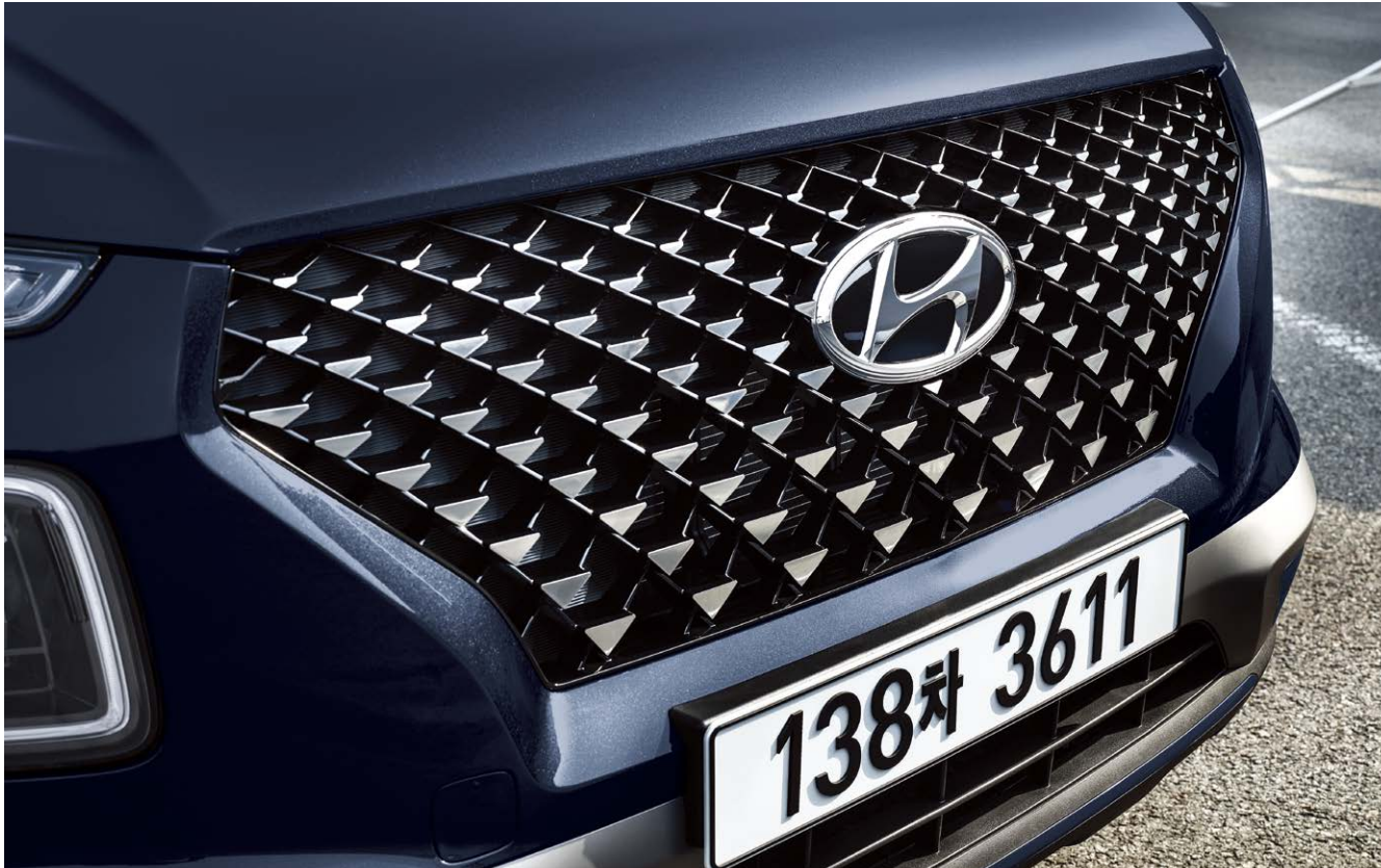
FLUX 전용 핫스탬핑 라디에이터 그릴