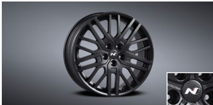
19인치 블랙 경량 휠 & 리얼 카본 휠캡 [단독 선택 시 87만원]