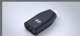
C to USB-A 변환 젠더

※ 위 H Genuine Accessories는 쏘나타 N Line 차량에도 적용 가능합니다. ※ LED 라이팅 플러스 패키지의 도어스윙 램프는 1열에만 적용됩니다. ※ C to USB-A 변환 젠더는 현대자동차 전용 개발 제품으로 타 제품 및 타 자동차 브랜드에서는 작동을 보장하지 않습니다. ※ H Genuine Accessories 신차 옵션 상품 선택 시 납량, 철국, 영남 출고센터에서만 출고가 가능합니다. ※ 위 상품은 트림 및 옵션 선택에 따라 적용 가능 여부가 달라질 수 있습니다. 자세한 사항은 해당 일의 가격표를 참고해 주시기 바랍니다. ※ H Genuine Accessories 신차 옵션 상품 선택 시 기존에 장착된 부품의 처리 비용은 해당 패키지 판매가격에 반영되어 있어 별도의 보상은 없습니다.