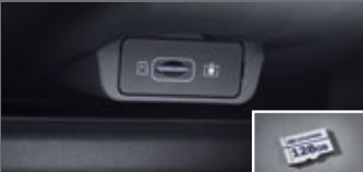
빌트인 캠 2 전용 마이크로SD 카드(128GB)