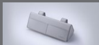
선박이저 선글라스 케이스