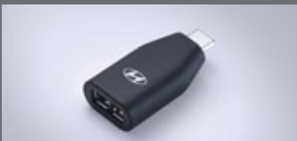
C to USB-A 변환 젠더

※ 위 H Genuine Accessories는 쏘나타 N Line 차량에도 적용 가능합니다. ※ LED 라이팅 플러스 패키지의 도어스텝 램프는 1열에만 적용됩니다. ※ C to USB-A 변환 젠더는 현대자동차 전용 개발 제품으로 타 제품 및 타 자동차 브랜드에서는 작동을 보장하지 않습니다. ※ H Genuine Accessories 신차 옵션 상품 선택 시 남양, 철곡, 영남 출고센터에서만 출고가 가능합니다. ※ 위 상품은 트림 및 옵션 선택에 따라 적용 가능 여부가 달라질 수 있습니다. 자세한 사항은 해당 월의 가격표를 참고해 주시기 바랍니다. ※ H Genuine Accessories 신차 옵션 상품 선택 시 기존에 장착된 부품의 처리 비용은 해당 패키지 판매가격에 반영되어 있어 별도의 보상은 없습니다. ※ 스마트 카드키는 자외선 차단 기능이 있거나 자성이 강한 휴대폰 케이스(ex. 맥세이프)를 사용하면 정상적으로 동작하지 않을 수도 있습니다. ※ 차량에 한 번 등록된 카드키는 최초 등록된 차량에만 해지 및 재등록이 가능하며, 다른 차량에 재등록 할 수 없습니다.