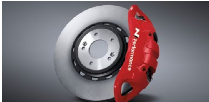
모노블록 4P 캘리퍼 & 하이브리드 디스크 & 로우 스틸 패드