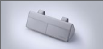
선바이지 선글라스 케이스