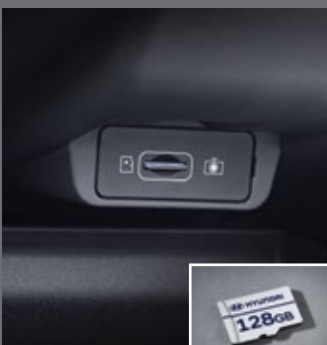
빌트인 램 2 전용 마이크로SD 카드(128GB)